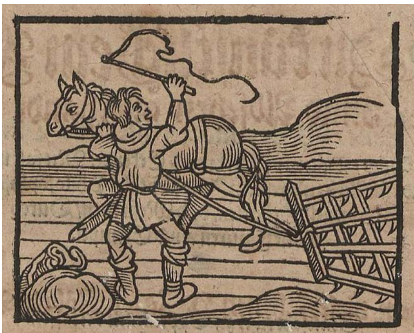
Åkern harvas. "Ackerbau", träsnitt av Jacob Koebel.