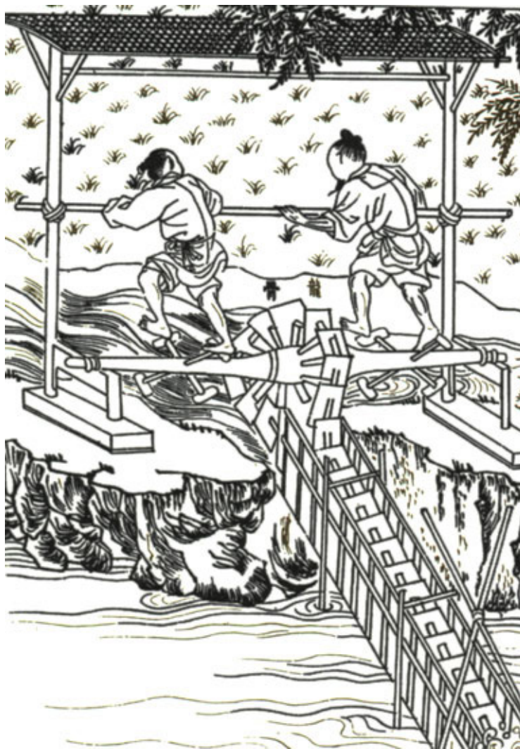
Bevattningsarbete i Kina.