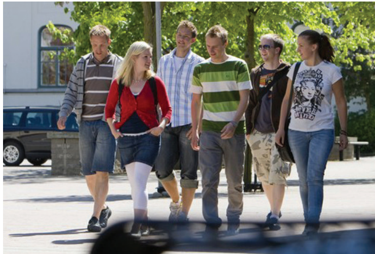
På väg mot arbetslivet (arkivbild).

I samtliga klasser som undersöktes var jag själv ute och genomförde enkätundersökningen. Jag introducerade den och förklarade vad jag skulle använda resultatet till. Jag berättade om min idé att skriva fyra berättelser om arbete. Att fylla i enkäten var frivilligt liksom att svara på samtliga frågor eller att ge alla uppgifter som efterfrågas i ingressen.