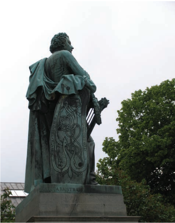
Fig. 1. Tegnér statuen i Lundagård (1853) set i profil med runestenen (foto forfatteren).

Travle lundensere, studerende og turister passerer dagligt forbi statuen af Esaias Tegnér i Lundagård i skyggen af store træer og med udsyn til domkirkens imponerende apsis (fig. 1). Statuens placering er ikke tilfældig. I sin tid først som docent og adjunkt i æstetik, siden professor i græsk ved Lunds universitet 1812–1824 slog Tegnér igennem som svensk romantiks betydeligste forfatter. Det var i 1820’ernes Lund, at Tegnér skrev sit måske mest kendte værk, Frithiofs saga.