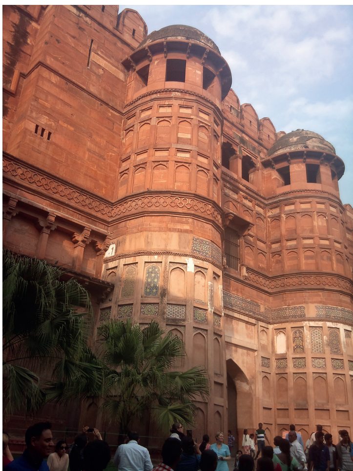
Bild 6. Det fantastiska fortet i Agra.

Efter ganska många timmar kommer bussen fram till Agra som med sina 1,7 miljoner känns modest och småskalig jämfört med Delhi. Bufflar drivs genom gatorna. Längs Yamunas stränder ligger färgglada textilier på tork, vilka tydligen ska användas för festligheter. Första uppehållet är ett klassiskt turistmål: gravmausoléet Taj Mahal, ”palatsens krona” som byggdes mellan 1632 och 1653. Trots de horder av försäljare som antastar besökarna är det ingen turistfälla: de många fotografier av Taj Mahal jag genom årens lopp sett kan definitivt inte göra rättvisa åt den marmorvita gravbyggnaden. Runt om mausoléet står en rad andra praktfulla byggnader som sällan syns i böcker eller nätsajter. Det är en lagom varm dag med strålande solsken vilket förstärker den positiva upplevelsen, trots att jag tillfälligt drabbats av ”turistmage” och är långt ifrån i toppform för utfärder. Byggherren var som bekant stormogulen Shah Jahan som med detta mausoleum visade sin uppskattning och kärlek för hustrun Mumtaz Mahal som födde fjorton