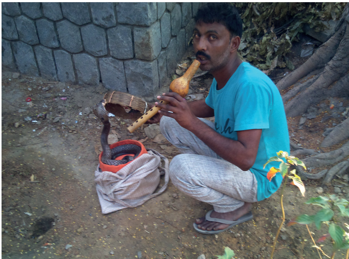
Bild 1. En ormtjusare med sin kobra utanför Mahatma Gandhis kremeringsplats.

daren Swaminarayan (1781-1830) – det finns även sådana i Västeuropa. Swaminarayan hävdade att han var en manifestation av den högste gudomen, och hans anhängare tycks inte hysa tvivel om den saken. 7000 hantverkare slet i mer än fyra år för att färdigställa komplexet invid Yamunas flodbädd som kunde invigas i november 2005.