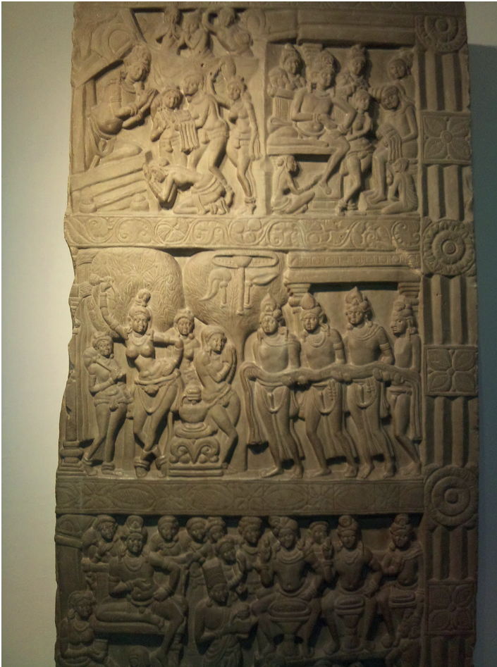
Bild 8. Suggestiv buddistisk relief från de första seklerna e.Kr.

fångar mig är det miniatyrmåleri som florerade under stormogulernas tid från 1500- till 1700-talet. De fantastiskt välgjorda och detaljerade målningarna har ibland drag av ”occidentalism” med bibliska scener med män i västerländska kläder.