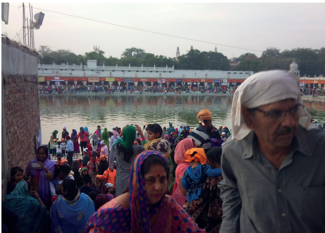
Bild 4. Från tempelkomplexet Gurdwara Bangla Sahib.

som tillåter våld i syfte att försvara sin och andra religioner. Den siste gurun dör i sviterna av ett mordförsök år 1708, men inte förrän han förklarat den heliga texten Guru Granth Sahib som sin "efterträdare" - den nuvarande och eviga sikhiska gurun. Runtom i världen finns gurdwaras ("portar till gurun") vilket är tempel där exemplar av den heliga skriften förvaras. Ett sådant tempel är Gurdwara Bangla Sahib på Ashoka Road, inte så långt från vårt hotell. Det uppfördes på 1700-talet men har byggts om upprepade gånger så att inte mycket lär finnas kvar från den tiden. Under dagen företar stora skaror en pilgrimsvandring i tempelkomplexet. Turligt nog för oss är sikhismen tolerant mot utomstående så att även anhängare av andra religioner och icke-religiösa har rätt att delta. Sikhismen lär nämligen att alla trossystem har sin väg till sanningen. Dock får vi anpassa oss till gällande förhållningsregler: strumpor och skor åker av och vi täcker huvudena med ett stycke tyg.