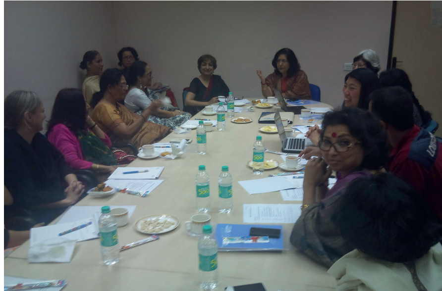
Bild 7. I samspråk med genusforskarna vid Indira Gandhi National Open University.

Mer universitet. Denna gång ett som kan briljera med siffror som slår även härdade internationaliseringsansvariga med häpnad. Det gäller Indira Gandhi National Open University, eller kort och gott IGNOU, med över fyra miljoner studenter. Hälften av Sveriges befolkning i ett lärosäte, ungefär. Icke överraskande är det med god råge världens största universitet, före Anadolu i Turkiet och Azad-e Eslami i Iran. Det ska dock genast tilläggas att IGNOU är utspritt på 3000 studiecentra i och utanför Indien och i första hand satsar på nätundervisning. Vår grupp bussas till School of Gender and Develop-