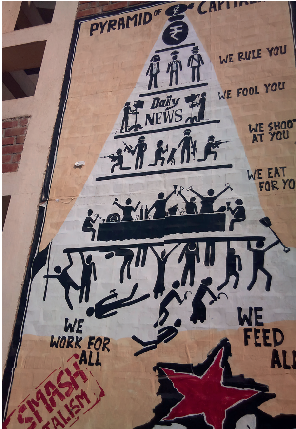
Bild 3. JNU:s version av den klassiska ”kapitalismens pyramid”. Skrivtecknet vid pyramidens topp betyder ”rupier”.

Idag är den stora universitetssafarin. På morgonen bussas gruppen till Jawaharlal Nehru Universitys stora campusområde. JNU är ett unikt elituniversitet med ”bara” 7500 stu-