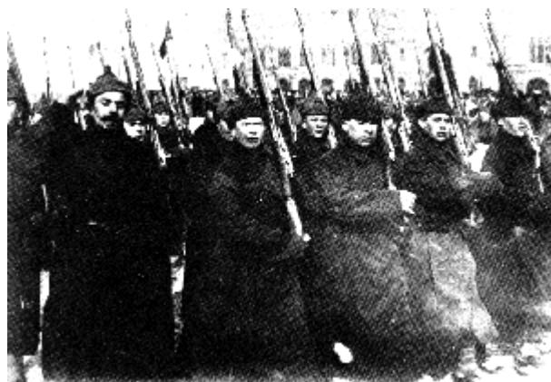
Ryska trupper paraderar på Röda torget.

I det polska högkvarteret utarbetades raskt en plan som gick ut på att cirka 150 kilometer sydost om Warszawa sammandra en så stark anfallsstyrkan som möjligt och därifrån slå mot Tuchatjevskijs södra flank. Anfallet fick skjutas upp till mitten av augusti, men då drog det hela igång och ledde snabbt till polska framgångar. Framåtandan i det polska anfallet överrumplade i viss mån ryssarna och de befann sig snart på reträtt över hela fronten. Polackerna eftersträvade att under frammarschen lägga beslag på ryssarna hästar och motorfordon för att öka hastigheten på framryckningen. Sedan polska arméförband vunnit ytterligare framgångar slöts det vapenstillestånd i oktober 1920. Fred slöts i Riga den 18 mars 1921. Polen erhöll då de gränser mot Sovjetunionen, som ägde bestånd till tiden för andra världskriget.